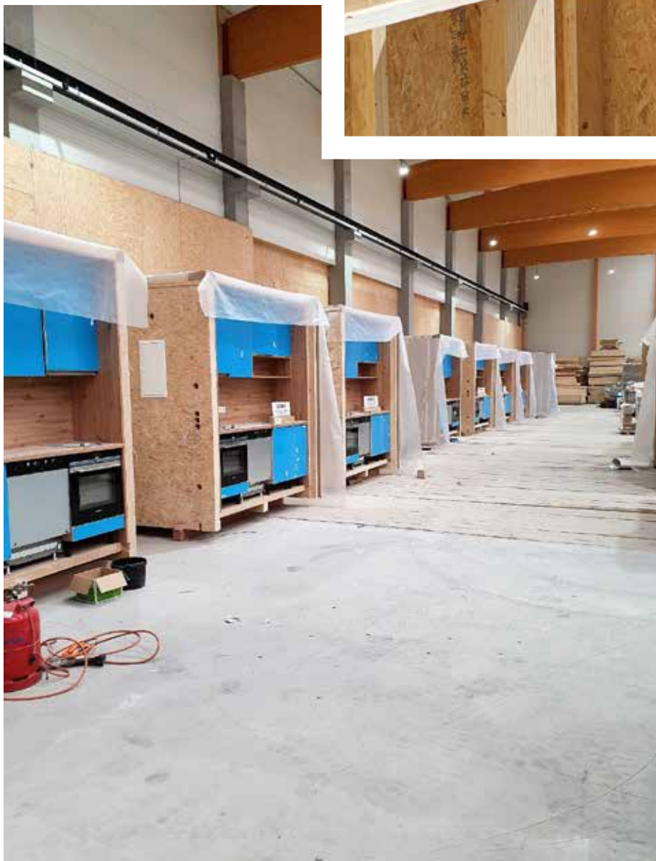
Fertige Bad- und Küchenmodule mit tragender Funktion, Foto Dirk Heidschuster

Digitalisierung im Bauwesen heißt digitale Planung, digitale Produktion, digitale Formfindung und das digitale Bauen (BIM). Dies stellt viele Zimmerbetriebe vor eine enorme Herausforderung. Nicht jeder kann hier sein digitales Bausystem aufbauen. Aber ein Netzwerk kann hier helfen und Teile der Planung auslagern. Mit hagekon haben wir in der hagebau ein funktionierendes Netzwerk.