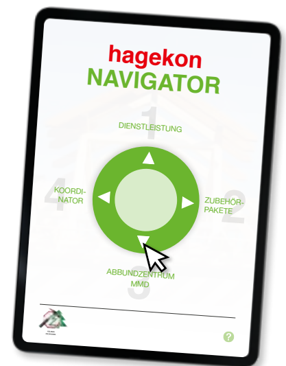
hagekon: das Planungsnetzwerk des Holzbau Fachhandels

Was ist hagekon? Ein Planungsnetzwerk für die Holzbauplanung, Arbeitsvorbereitung, Schall- und Brandschutzfragen. Fragen Sie bitte Ihren Fachhandelsstandort!