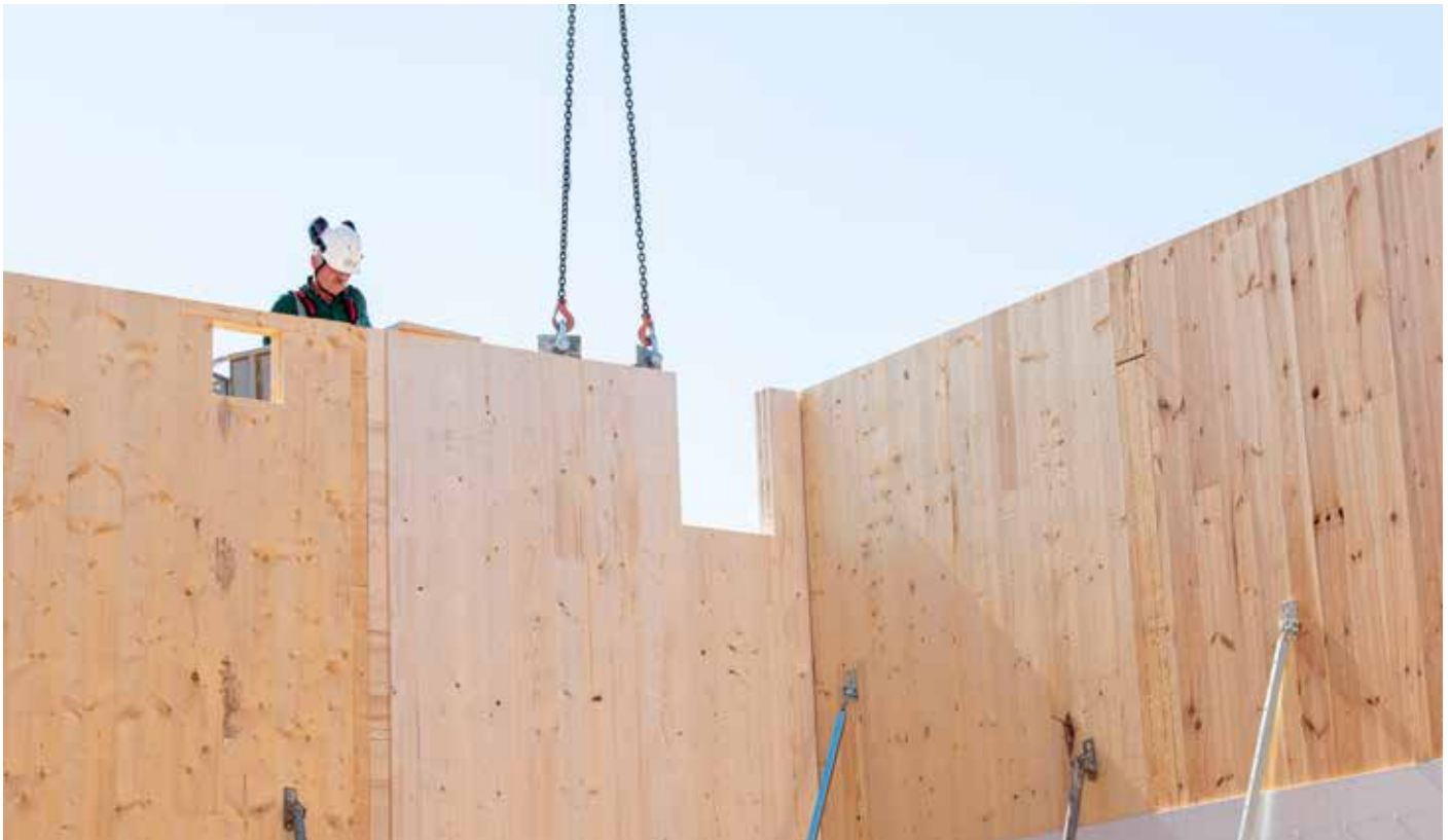
Fertige Holzbauteile, hier in Form von Brettsperrholz (CLT)