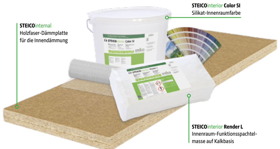
STEICOinternal Holzfaser-Dämmplatte für die Innendämmung

Alles aus einer Hand: Das neue STEICOinterior Beschichtungssystem auf Kalkbasis ergänzt die Vorteile von Holzfaser-Dämmplatten in einer aufeinander abgestimmten Produktlinie für den Innenbereich. Die diffusionsoffenen, sorptionsfähigen Komponenten unterstützen das Feuchtmanagement und können zu einem ausgeglichenen Raumklima und zum Schutz vor Schimmel beitragen.