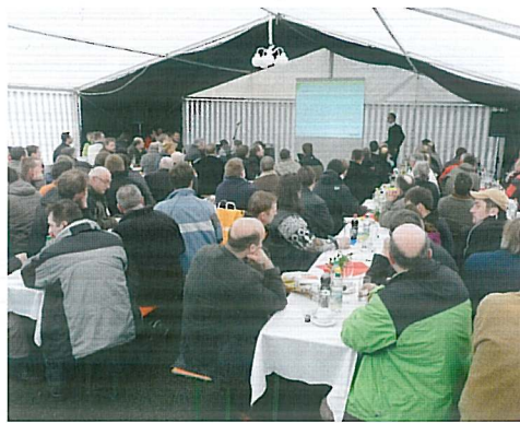
Vorträge verschiedener hochkarätiger Experten zählten zu den Highlights der Veranstaltung.